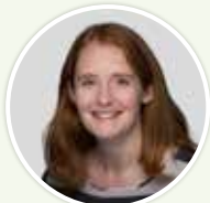
dr. Laura Coates